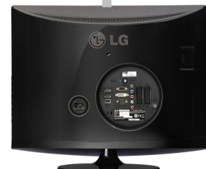
Voorbeeld achterkant televisie