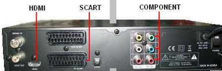
Voorbeeld achterkant Digitale Settop-box (ontvanger)