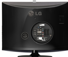
Voorbeeld achterkant televisie

Er zijn diverse mogelijkheden voor de aansluiting van uw digitale settop-box naar uw televisie. - HDMI kabel. - Component (groen, blauw en rode kabel) - Scartkabel. (Deze kan op iedere televisie en op iedere ontvanger aangesloten worden).