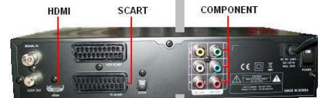
Voorbeeld achterkant Digitale Settop-box (ontvanger)